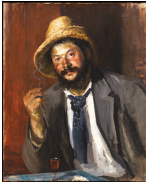
Ernst Josephson. Peinture: Louise Catherine Breslau, 1886.

J'estime que la création de Québec solidaire en 2006 est la principale réalisation de ma vie de militant politique. Cette aventure, qui a permis l'union de la gauche, a commencé quelques mois après ma retraite en 1997. Avec le concours de L'aut'journal , j'ai d'abord agi comme bougie d'allumage pour mettre sur pied un mouvement d'action politique appelé le Rassemblement pour une alternative politique (RAP). Ce dernier a regroupé quelques centaines de progressistes se sentant trahis par la conversion au néolibéralisme du gouvernement péquiste de Lucien Bouchard. Puis est survenue, en 2001, l'élection dans Mercier où, pour la première fois, la plupart des petits partis de gauche se sont ralliés autour d'une candidature commune. J'ai eu l'honneur d'être le porte-étendard de cette alliance et j'ai obtenu un score inespéré de près de 25% des votes. Ce résultat probant a permis de franchir une étape cruciale: la fusion de trois partis de gauche qui, en 2002, donne naissance à l'Union des forces progressistes (UFP). Pour couronner cette avancée survient, en 2006, la création de Québec solidaire, issu de la fusion de l'UFP et du mouvement Option citoyenne. Et aujourd'hui encore, à l'orée de ma 85 e année, je contribue du mieux que je peux au combat pour l'émancipation sociale et la libération nationale du Québec.