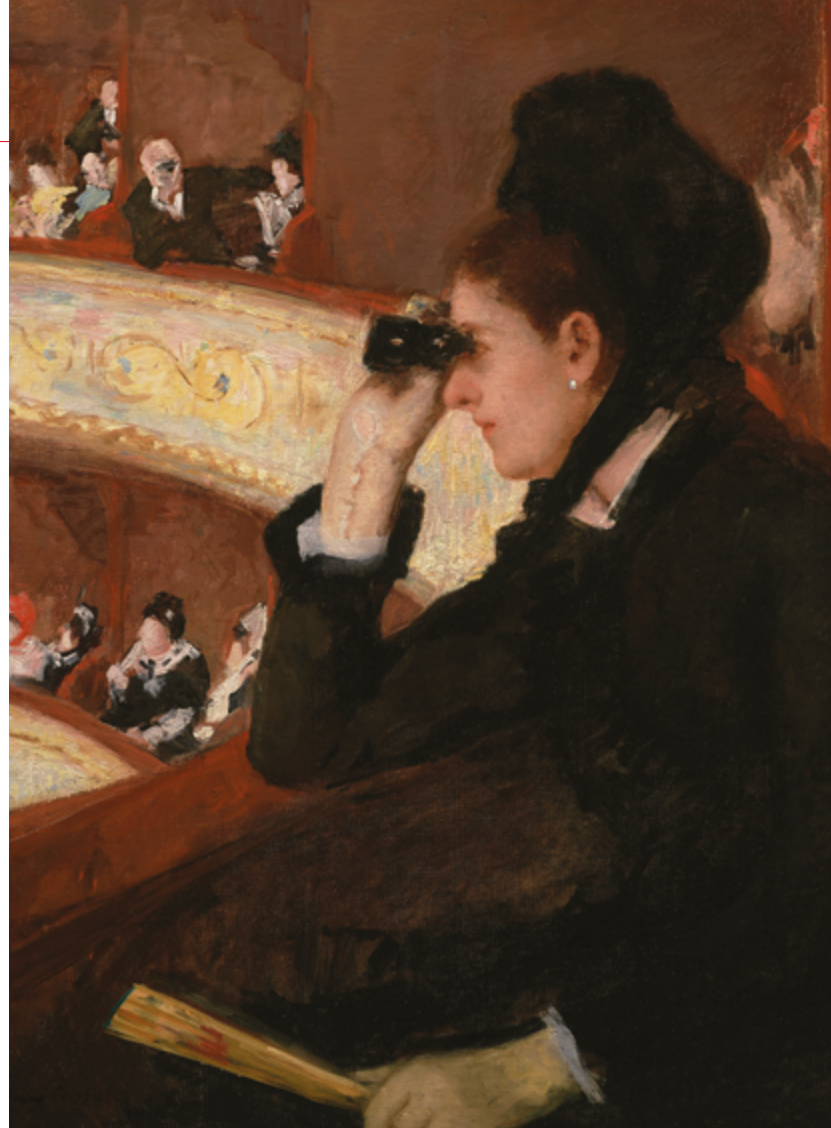
In the Loge. Peinture : Mary Stevenson Cassatt, 1878.