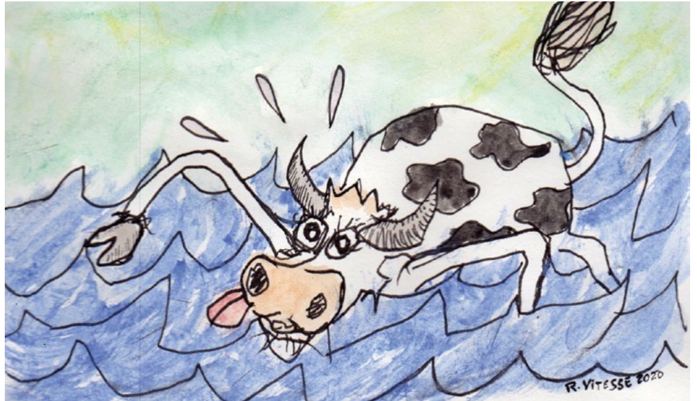
Illustration: Ramon Vitesse.

Parmi les vingt États émettant le moins de gaz à effet de serre à l'échelle mondiale, dix-huit sont des pays d'Afrique, dont le Nigeria, le Kenya et le Zimbabwe, qui ne dépassent pas la tonne annuelle de CO 2 par habitant·e. D'après le Global Carbon Atlas, il suffirait d'à peine cinq jours à un·e Britannique pour émettre la même quantité de carbone qu'un·e Rwandais·e pendant une année entière. Autrement dit, un·e osti d'pauvre qui se fout de l'environnement pollue moins qu'un·e riche écolo. On se demande bien qui va sauver la croissance et la richesse.