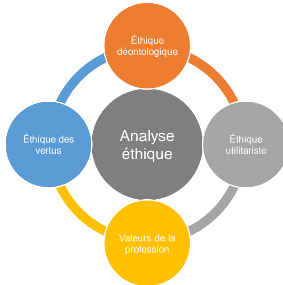
Figure 3 : Les quatre lunettes éthiques du Cadre éthique quadripartite

En quoi ces données sont-elles pertinentes et intéressantes d'un point de vue éthique? Cette section présente une réflexion sur ces données et leurs implications éthiques. À l'aide du Cadre éthique quadripartite [23], quatre analyses éthiques sont articulées (voir la Figure 3).