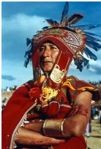
Le grand prêtre de l'Inti Raymi les bras ensanglantés par le sacrifice du lama qu'il vient de célébrer

Les dessins de la chronique de Guaman Poma de Ayala [24], l'autre chroniqueur-culte aux racines préhispaniques, ont été exploités, tandis que les objets provenant des fouilles qui sont entreposés au musée municipal de Cuzco, ont été reproduits et agrandis à l'échelle de la scène immense de l'esplanade de Sacsayhuaman (photos 3 et 4).