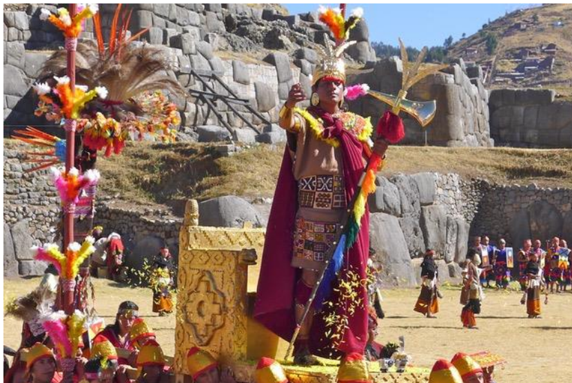
L'inca en procession lors de l'Inti Raymi, le néo-culte du Soleil

Le dispositif cérémoniel tient à la fois de Disneyland et de la procession des Christs de semaine sainte : j'ai vu des hommes enlever leur chapeau et même s'agenouiller au passage du trône de l'Inca. Auparavant, le souverain était apparu à une foule qui l'attendait depuis des heures au Qoricancha, au milieu des vestiges du temple du Soleil préhispanique. Ce néo-culte solaire qui met en scène la gloire des ancêtres mythiques dure une semaine et les sites archéologiques en sont en quelque sorte les supports : ils transforment le mythe en histoire rêvée et excluent les Indiens de leur autochtonie. Il faut noter que les archéologues ont joué, dès le début, le rôle de caution académique, spécialement dans le design des objets manipulés et des vêtements de la scénographie (photo 2).