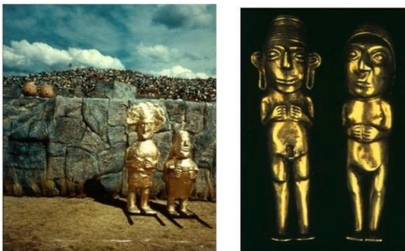
Des objets archéologiques exposés au Musée municipal de Cuzco et leurs équivalents démultipliés sur la scène de l'Inti Raymi

Cet usage de l'archéologie doit être considéré dans le cadre d'un néo-incaïsme effervescent qui s'exprime essentiellement dans les rituels. En effet des cérémonies dites préhispaniques sont réinventées partout dans la ville de Cuzco : dans les supermarchés, les banques et l'université, on fait des offrandes à la Pachamama (Terre Mère), aux sommets des montagnes ou Apu, tandis que des cures magiques inspirées des pratiques indigènes sont proposées au lobby des hôtels de tourisme. La culture traditionnelle des Indiens est, selon les points de vue, pillée ou réinventée dans le cadre d'une exaltation néo-incaïste.