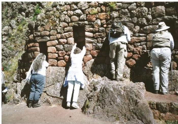
Des mystiques new age recueillent l'« énergie » des Incas dans des niches du site archéologique de Pisac

S'ils ont donné leur tribut, leur terre, leur minerai, leur travail, leur histoire, les Indiens sont à présent appelés à offrir leur énergie cosmique. Celle-ci est un bien virtuel, tout comme les valeurs financières que l'on joue en bourse. Et l'on peut ainsi réfléchir à la cohérence entre ces deux valeurs virtuelles, d'une part l'énergie captée par les mystiques New Age, et, d'autre