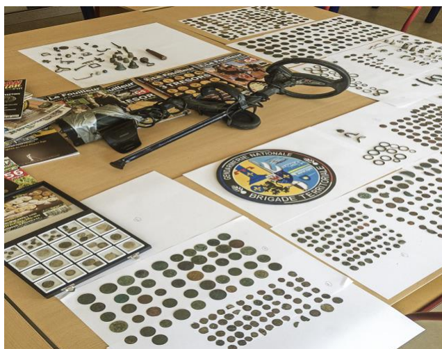
Fig. 2. Vue d'ensemble d'une saisie effectuée en 2017 par la Gendarmerie nationale dans le département des Bouches-du-Rhône, Delestre [35].

Pour tenter de mettre un frein à ces pillages de sites archéologiques sans aucun rapport avec une prétendue action de dépollution des terrains ou une activité de loisir, entre 2015 et 2019 plus d'une centaine de plaintes et signalements au titre de l'article 40 du code de procédure pénale ont été déposés par le service régional de l'archéologie de la direction régionale des affaires culturelles de Provence-Alpes-Côte d'Azur auprès des tribunaux au cours de ces quatre dernières années. 55 perquisitions ont été réalisées [34,35] (figure 2).