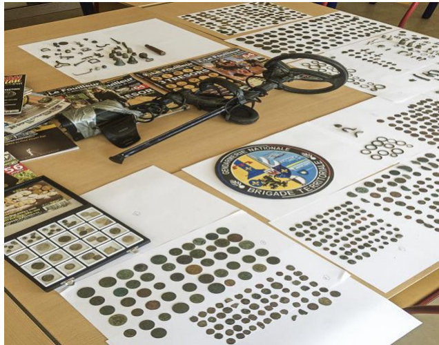
Fig. 2. Vue d'ensemble d'une saisie effectuée en 2017 par la Gendarmerie nationale dans le département des Bouches-du-Rhône, Delestre [35].

Pour tenter de mettre un frein à ces pillages de sites archéologiques sans aucun rapport avec une prétendue action de dépollution des terrains ou une activité de loisir, entre 2015 et 2019 plus d'une centaine de plaintes et signalements au titre de l'article 40 du code de procédure pénale ont été déposés par le service régional de l'archéologie de la direction régionale des affaires culturelles de Provence-Alpes-Côte d'Azur auprès des tribunaux au cours de ces quatre dernières années. 55 perquisitions ont été réalisées [34,35] (figure 2).