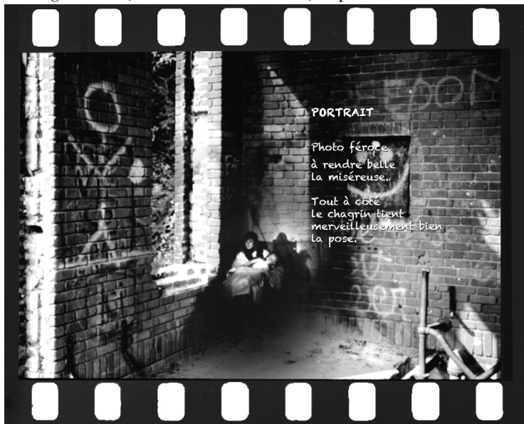
Photo féroce / à rendre belle / la miséreuse. // Tout à côté / le chagrin tient / merveilleusement bien / la pose.