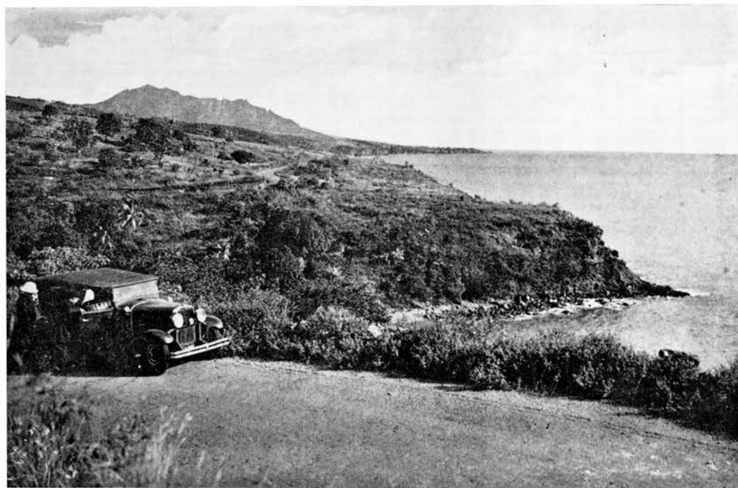
Le site et la plage de ROCROI vers 1930