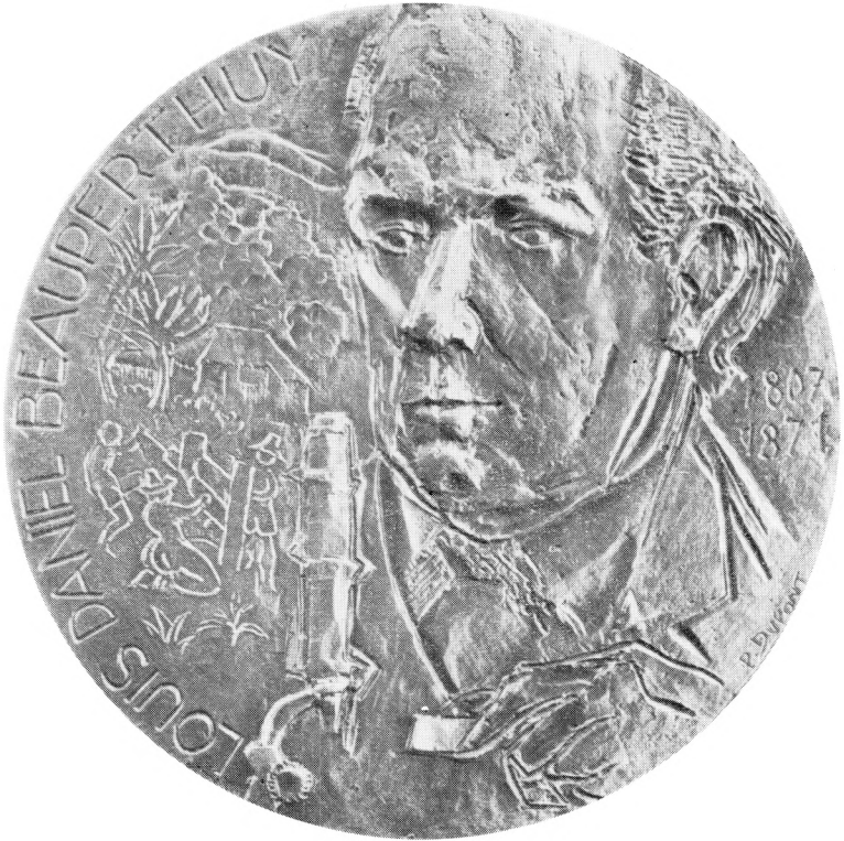
Médaille du centenaire, avers. (Monnaie de Paris, 1971)