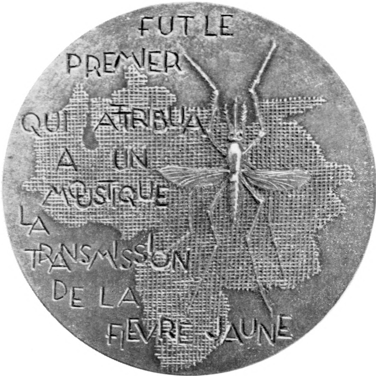
Médaille du Centenaire, revers. (Monnaie de Paris, 1971)