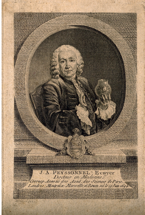
Figure 3: Dr. Jean-André Peyssonnel (1694-1759)