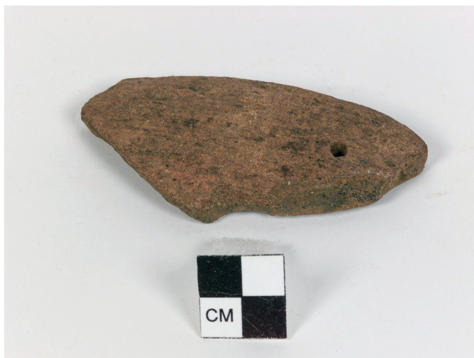
Figure 6 : Tesson de céramique de l'Habitation Union acquis par Theodoor de Booy en 1916 et conservé au National Museum of the American Indian (Smithsonian Institution, Washington).

attribué à « Coridon », c'est-à-dire, Villebrode Coridon, un haut fonctionnaire colonial qui s'est intéressé aux antiquités amérindiennes de Martinique 20 . D'après Eugène Revert 21 , Coridon avait acquis cette pièce de l'Habitation Union. Qu'est-elle devenue ensuite ? A-t-elle rejoint la petite collection archéologique publique de Fort-de-France, mentionnée par Jesse Walter Fewkes 22 ? Quoi qu'il en soit, le père Jean-Baptiste Delawarde a eu accès à l'objet dans les années 1930. Il en a offert une description dans sa Préhistoire martiniquaise , et en a même fait un moulage pour le musée d'ethnographie du Trocadéro 23 ; ce moulage de 8,4 × 11,1 × 2,2 cm est aujourd'hui conservé au musée du quai Branly-Jacques Chirac (Paris), sous la référence 71.1933.26.2 (Figure 7).