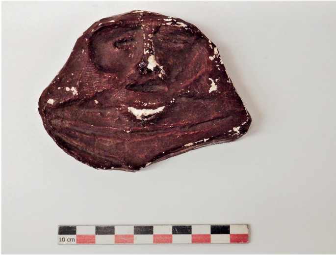
Figure 7 : Moulage réalisé par le père Jean-Baptiste Delawarde et conservé au musée du quai Branly-Jacques Chirac (Paris).

Sainte-Marie), qui a motivé plusieurs campagnes de recherches archéologiques à partir des années 1930, livrant un abondant mobilier du Saladoïde Cedrosan Ancien (100 avant J.-C.-350 après J.-C.) 25 .