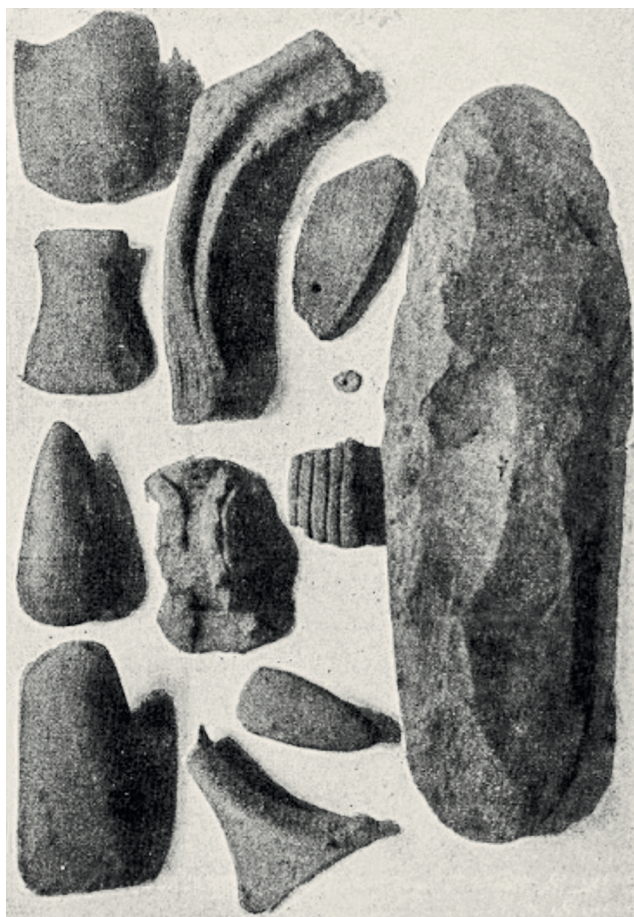
Figure 3 : Objets précolombiens découverts par Gustave Bordaz dans l'Habitation Union.