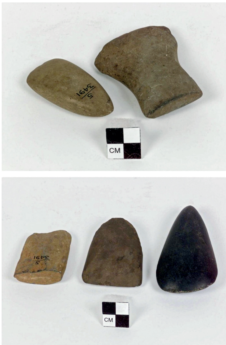
Figure 5 : Haches de l'Habitation Union acquises par Theodoor de Booy en 1916 et conservées au National Museum of the American Indian (Smithsonian Institution, Washington).