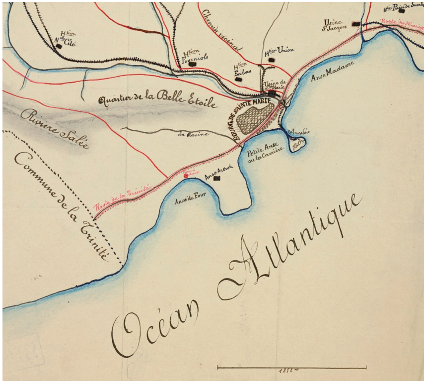
Figure 2 : Détail d'un plan de la commune de Sainte-Marie mentionnant l'Habitation Union. Auteur : H. Lacour. Année : 1899. Série Antilles du service géographique du ministère des Colonies, Archives nationales d'outre-mer (cote : FR ANOM CP ANT 10).