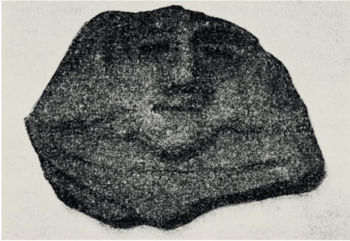
Figure 4 : Fragment de céramique orné découvert par Gustave Bordaz dans l'Habitation Union.