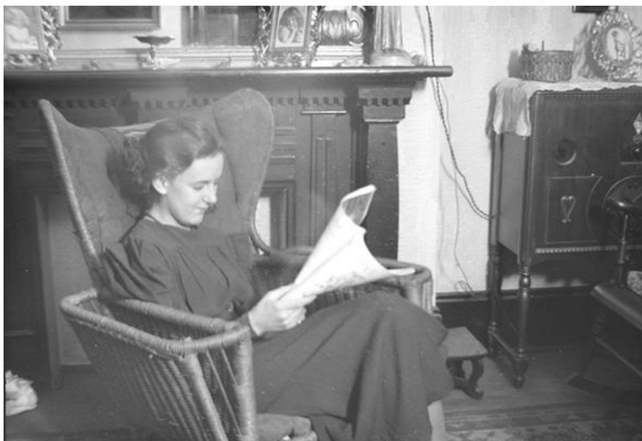
Conrad Poirier, Friends and Family. Catherine Brawley (1935), Photographie argentique

recours à la terminologie du middlebrow dans des travaux d'histoire littéraire et culturelle, cette dernière semble figurer un cadre descriptif plus qu'analytique, sorte de second plan dans lequel on peut retracer tantôt les pratiques culturelles urbaines des femmes (Savoie, 2016), tantôt la trajectoire singulière d'hommes et femmes de lettres et de médias (Bernier, 2017). Comme le constatait déjà Savoie en 2000, en l'absence d'ouvrages approfondis sur le sujet, la culture moyenne n'apparaît que de façon fragmentaire (20). Aussi, à la lumière du chantier conduit par Nicola Humble autour de la culture moyenne et de ce qu'elle nomme « l'histoire sociale des textes » (citée dans D'Hoker, 2011: 260), je veux proposer deux pistes de lecture nous permettant de revenir sur l'idée d'une esthétique du centre et d'une zone médiane. Ces pistes constituent, si l'on veut, de nouvelles hypothèses qu'une étude de grande ampleur, vaste et précise à la fois pourrait valider. Je les formule dans le but de stimuler une nouvelle réflexion sur l'enchevêtrement de différents mécanismes et logiques de légitimation à l'oeuvre dans la vie littéraire québécoise d'avant la « Révolution tranquille ».