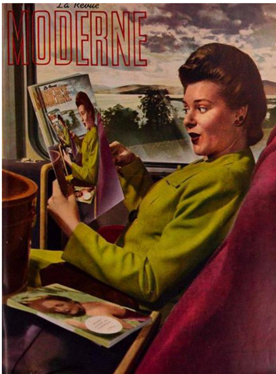
La Revue moderne (1945), Couverture de La Revue moderne , juillet 1945

S'il fallait entreprendre la construction d'un musée des grands thèmes qui jalonnent la critique littéraire québécoise, nul doute que la dyade populaire/savant y figurerait en bonne place. Je dis dyade, pour insister ici sur les effets d'opposition et de concurrence qui semblent marquer deux pôles ou bien contradictoires, ou bien convergents — dans tous les cas, deux sphères dont la relation viendrait figer la valeur des pratiques et des objets d'un côté et de l'autre. Une rapide observation du champ des études littéraires et culturelles au Québec révèle la prégnance de ce paradigme qui tend à structurer profondément la lecture et la critique des oeuvres : les cours, les demandes de subvention, les articles, livres et thèses le convoquent, souvent par principe ou par réflexe, à tout le moins pour en tirer une réflexion permettant d'éclairer les « tensions » à l'oeuvre