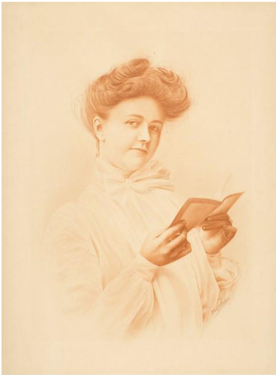
Albert Ferland, Femme lisant (ca 1900), Dessin d'après la photo de la jeune femme au livre , Sanguine, Fonds Albert Ferland