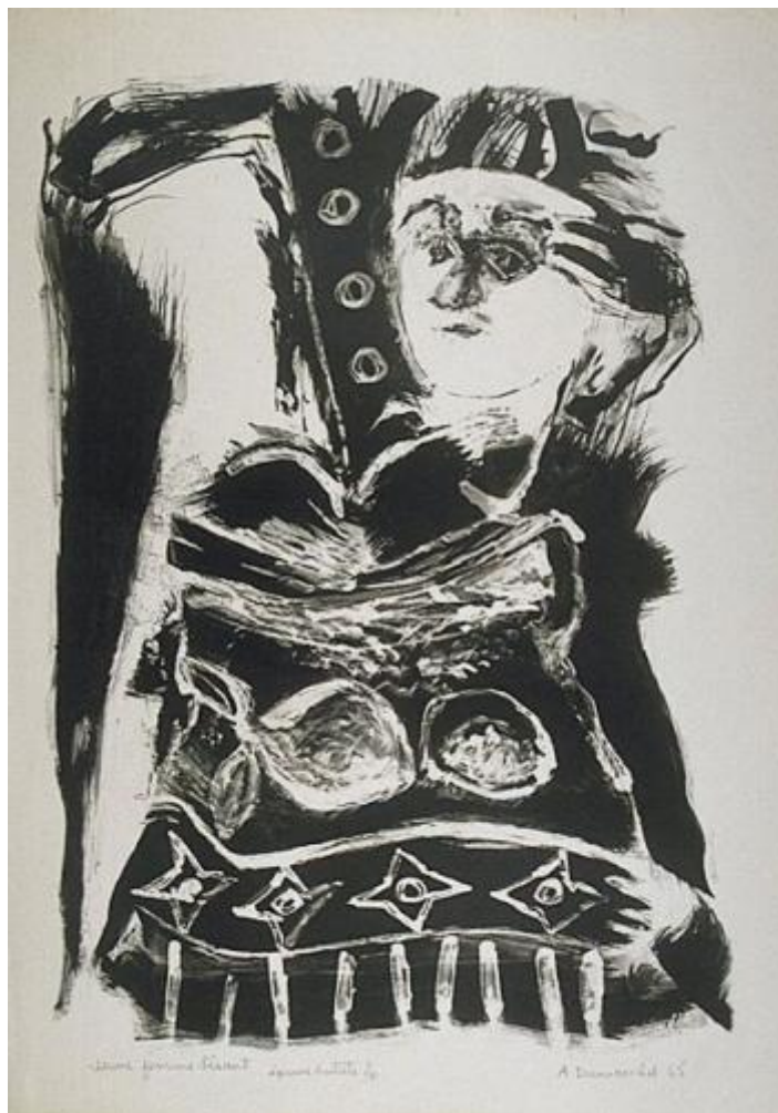
Albert Dumouchel, Jeune femme lisant (1965), Estampe | 76 x 57 cm