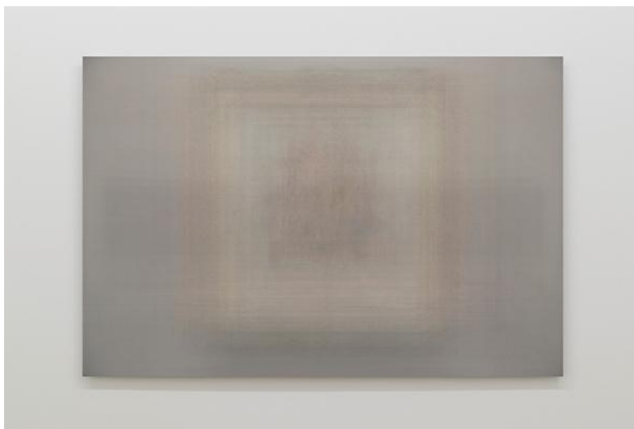
Martin Désilets, Matière noire, état 19 (2019), Oeuvre issue de la série Matière noire , Impression à jet d'encre sur papier Hahnemühle Photo Rag Baryta montée sur aluminium | 84 x 127 cm, Collection : Photo Élysée / Plateforme 10, Cette oeuvre est composée de la superposition de 1900 images-oeuvres