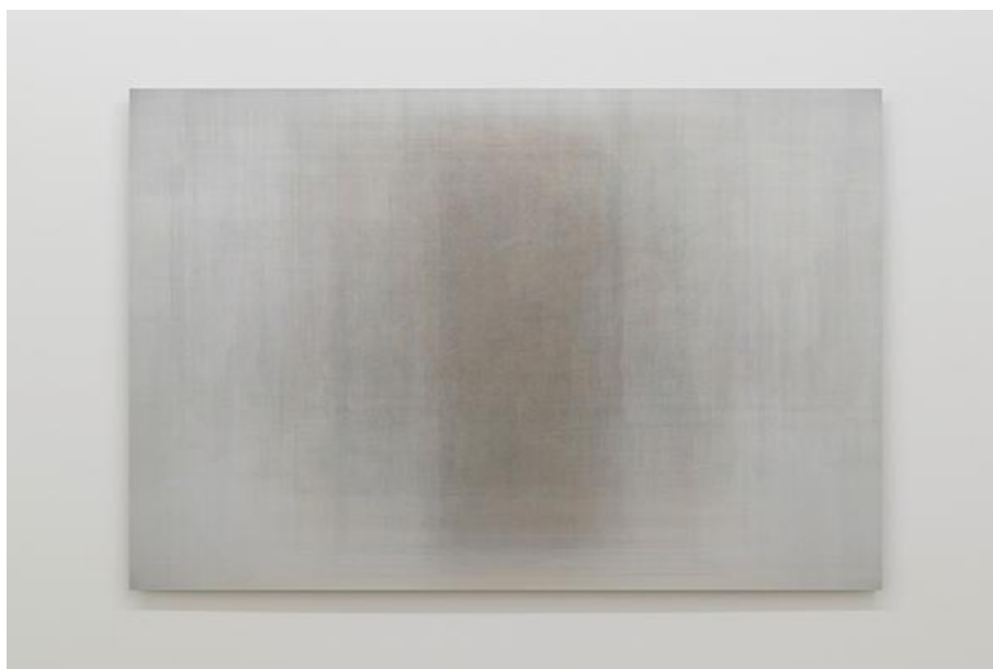
Martin Désilets, Matière noire, état 13 (2018), Oeuvre issue de la série Matière noire , Impression à jet d'encre sur papier Hahnemühle Photo Rag Baryta montée sur aluminium | 84 x 127 cm, Collection particulière, Cette oeuvre est composée de la superposition de 1300 images-oeuvres