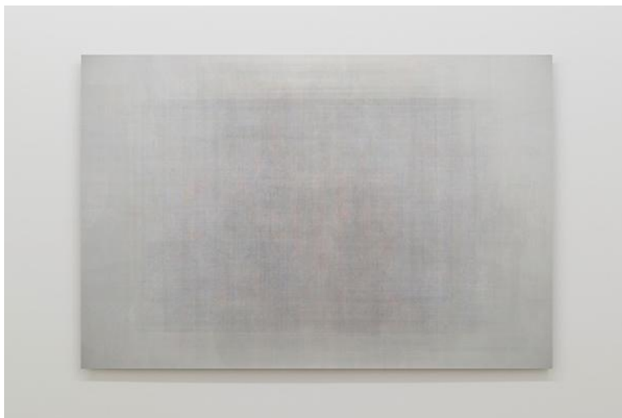
Martin Désilets, Matière noire, état 1 (2018), Oeuvre issue de la série Matière noire , Impression à jet d'encre sur papier Hahnemühle Photo Rag Baryta montée sur aluminium | 84 x 127 cm, Collection particulière, Cette oeuvre est composée de la superposition de 100 images-oeuvres