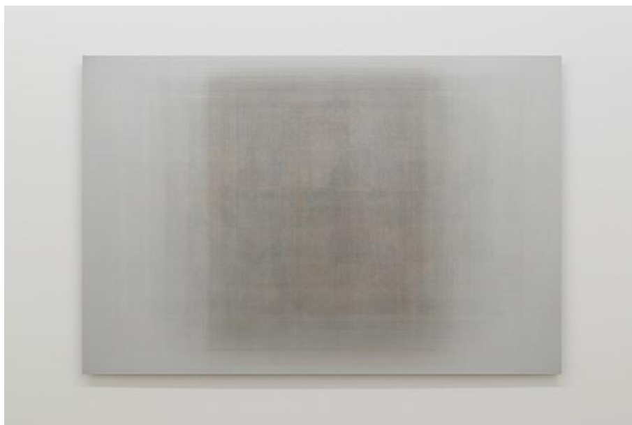
Martin Désilets, Matière noire, état 5 (2018), Oeuvre issue de la série Matière noire , Impression à jet d'encre sur papier Hahnemühle Photo Rag Baryta montée sur aluminium | 84 x 127 cm, Collection particulière, Cette oeuvre est composée de la superposition de 500 images-oeuvres

les fictions fantasmées et le réel. Elle mène donc une histoire parallèle du roman, moins sensible à de supposées ruptures esthétiques qu'à une forme de relais entre les oeuvres, où chaque nouveau « grand » roman relance les questions laissées en suspens par ses prédécesseurs. « Le roman n'existe que dans l'histoire et la continuité de son oeuvre. » (Daunais, 2002: 20)