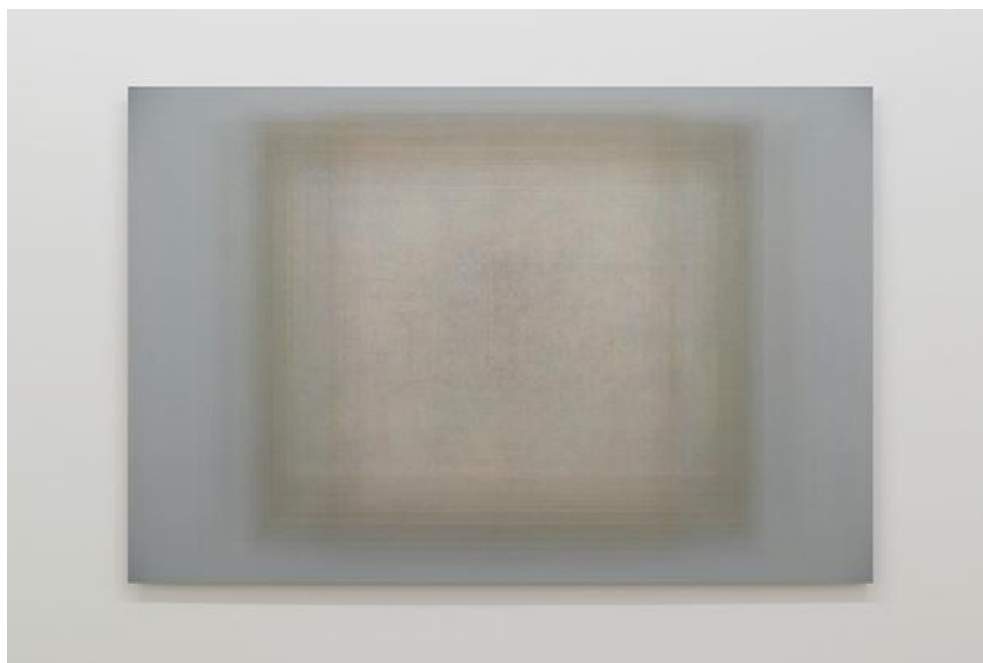
Martin Désilets, Matière noire, état 17 (2019), Oeuvre issue de la série Matière noire , Impression à jet d'encre sur papier Hahnemühle Photo Rag Baryta montée sur aluminium | 84 x 127 cm, Collection : Ville de Longueuil, Cette oeuvre est composée de la superposition de 1700 images-oeuvres