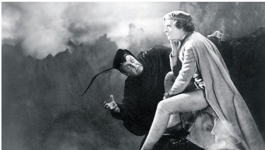
Friedrich W. Murnau, Faust, une légende allemande (1926)