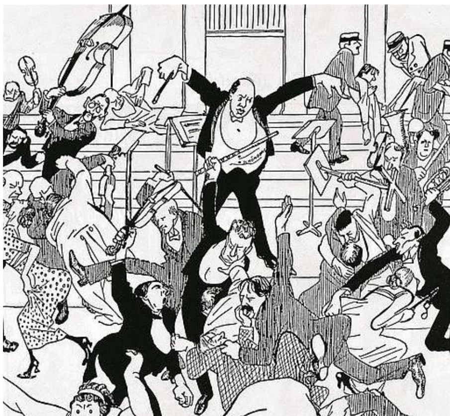
Anonyme, Das nächste Wiener Schoenberg-Konzert (1913)

Caricature inspirée du Skandalkonzert , publiée dans Die Zeit , 6 avril 1913