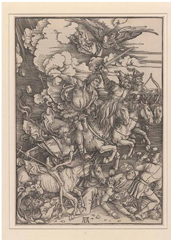
Albrecht Dürer, Les quatre cavaliers de l'Apocalypse (1497-1498)

Estampe, La Révélation de Saint Jean (Apocalypse)