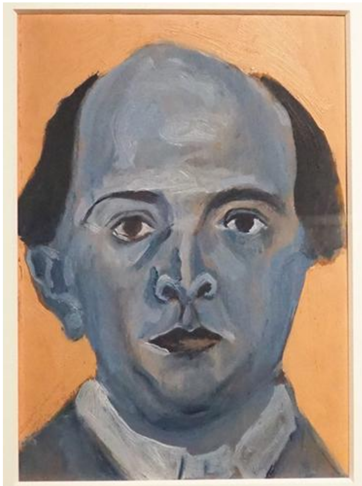
Arnold Schönberg, Autoportrait bleu (1910)