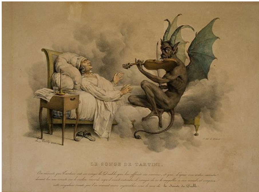
François-Séraphin Delpech, Le songe de Tartini (1824)