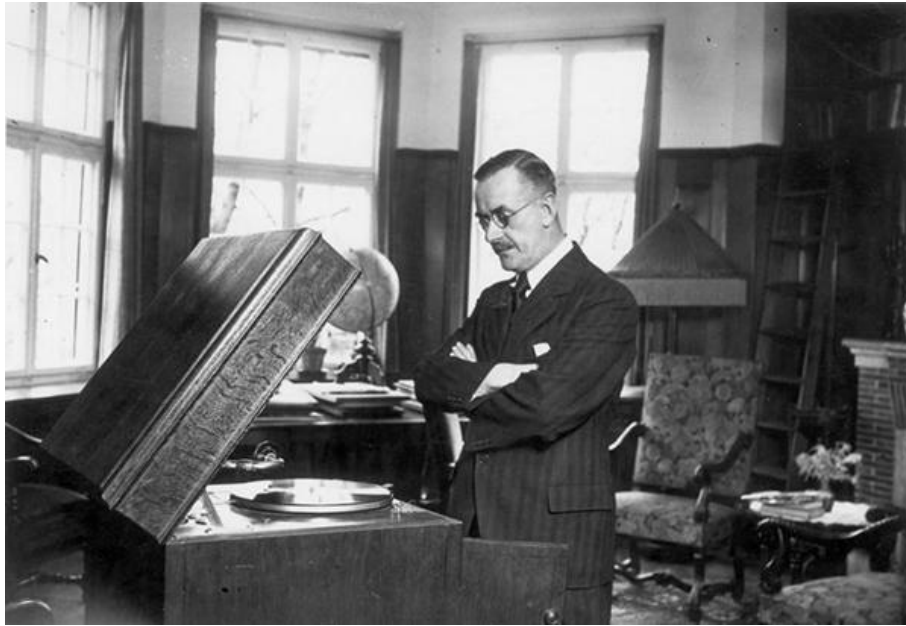
Thomas Mann dans son appartement à Munich (1932)