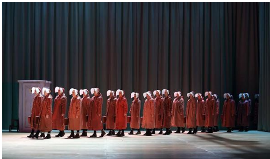
English National Opera, The Handmaid's Tale (2022)