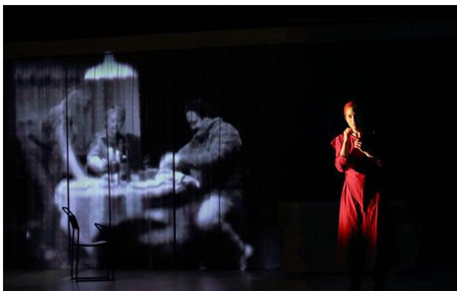
English National Opera, The Handmaid's Tale (2022)