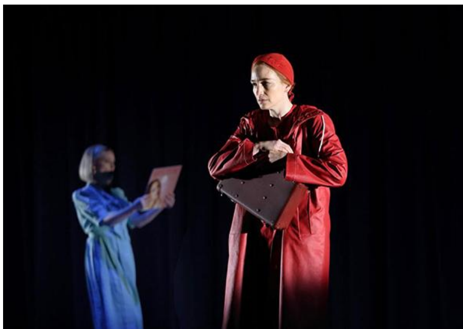
English National Opera, The Handmaid's Tale (2022)