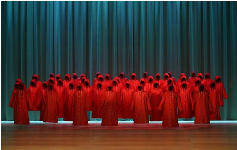
English National Opera, The Handmaid's Tale (2022)

Ruders a visiblement perçu avant tout le potentiel musical contenu dans le texte même du roman. En effet, l'épilogue révèle que le récit (« tale ») de la Servante est constitué de ses confessions enregistrées sur des cassettes audios par-dessus des musiques existantes, ce qui invite rétrospectivement à considérer le texte romanesque comme la transcription de ce récit oral, ou plus exactement comme la partition d'un palimpseste sonore qu'on lirait en silence. Dans cette perspective, la tâche du compositeur consiste à recréer, sous une forme musicale destinée à être jouée et chantée sur scène, ce palimpseste imaginaire. Au-delà du cas somme toute classique de l'adaptation intermédiaire d'un roman 8 , il s'est agi d'exploiter l'oralité et la musicalité inhérentes à l'oeuvre littéraire dans une co-création née de la rencontre de plusieurs imaginaires.