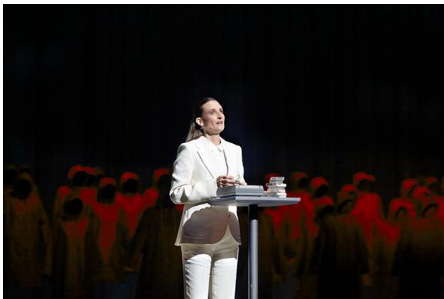
English National Opera, The Handmaid's Tale (2022)