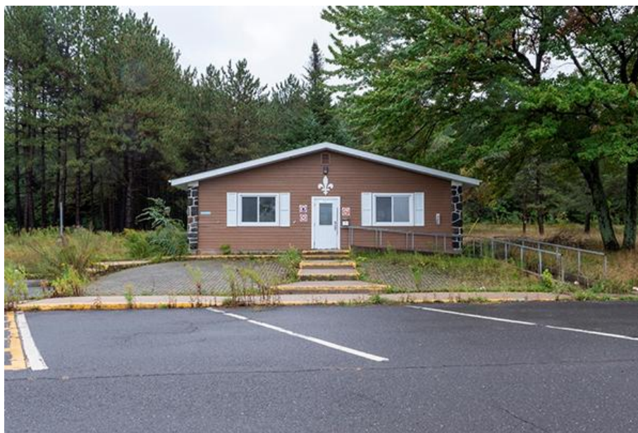
Thomas-Bernard Kenniff, Halte de l'Érable (2021)

Photographie numérique prise le 15 septembre 2021