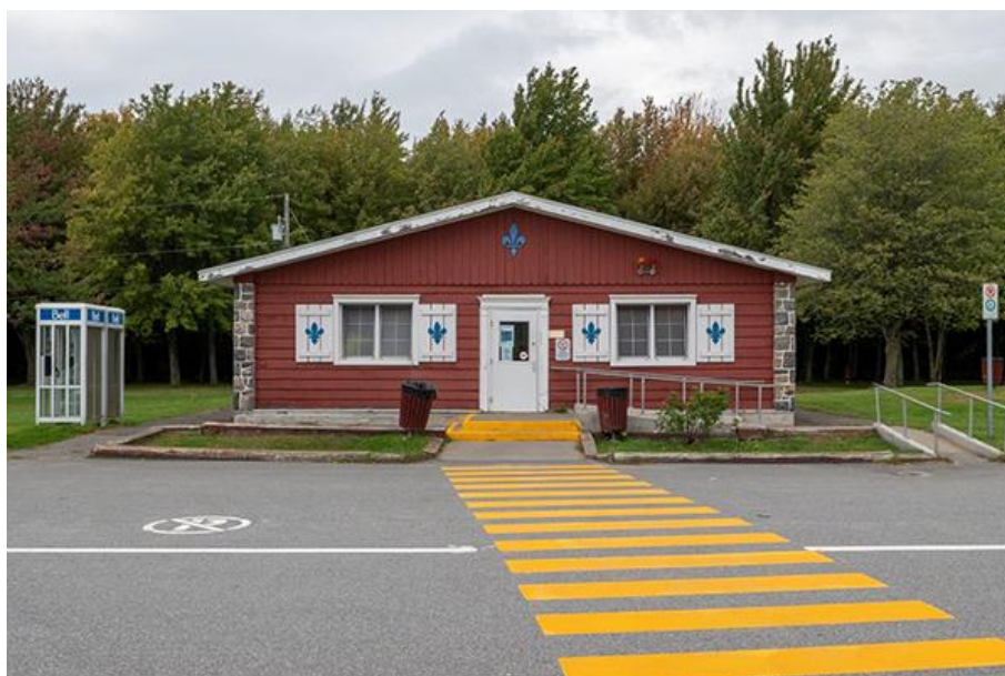
Thomas-Bernard Kenniff, Halte des Hurons (2021)

Photographie numérique prise le 27 septembre 2021