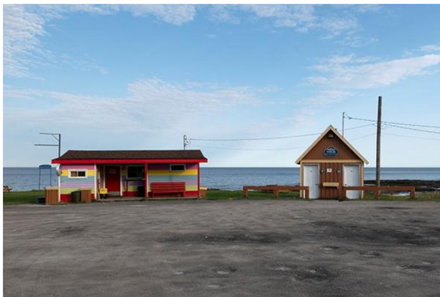
Thomas-Bernard Kenniff, Halte municipale de Sainte-Anne-des-Monts (2021)

Photographie numérique prise le 20 septembre 2021