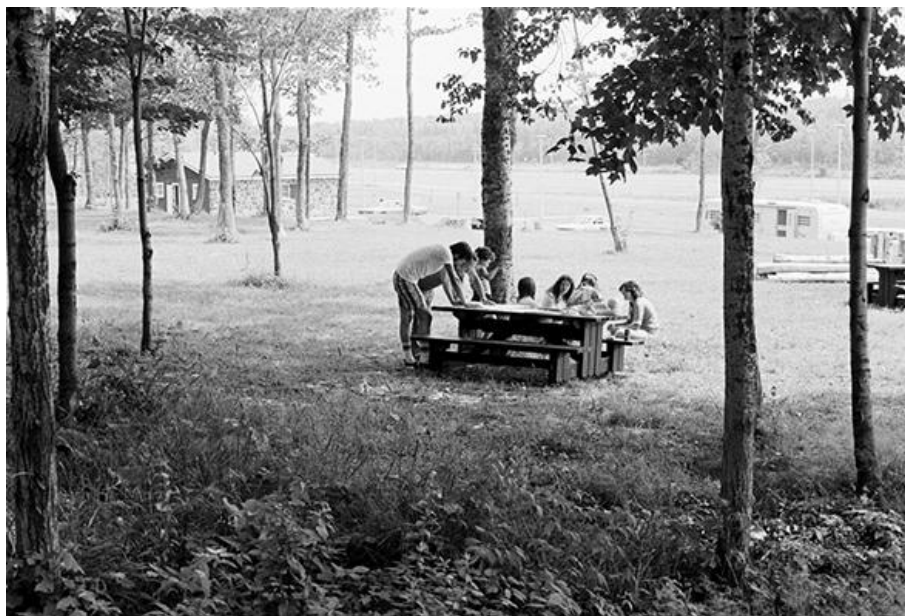
R. L., Halte routière de Bernières et vues de Vallée-Jonction, PC4 (1976)