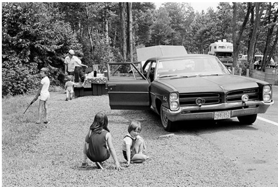
R. L., Halte routière de Bernières et vues de Vallée-Jonction , PB5 (1976)

Photographie argentique prise le 28 juillet 1976