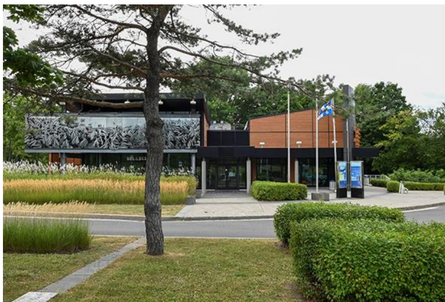
Thomas-Bernard Kenniff, Halte de Saint-Michel-de-Bellechasse (2021)

Photographie numérique prise le 28 août 2021