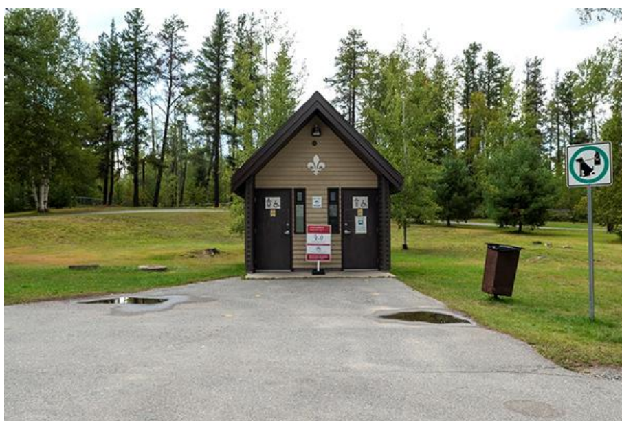
Thomas-Bernard Kenniff, Halte Alphonse-Dufour (2021)

Photographie numérique prise le 8 septembre 2021