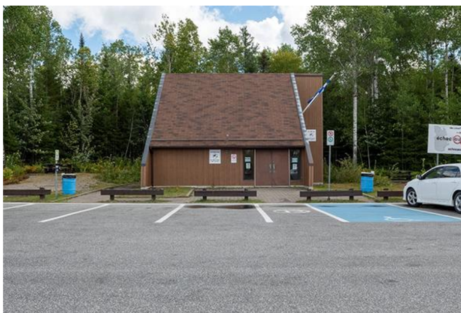
Thomas-Bernard Kenniff, Halte Villebon (2021)

Photographie numérique prise le 8 septembre 2021