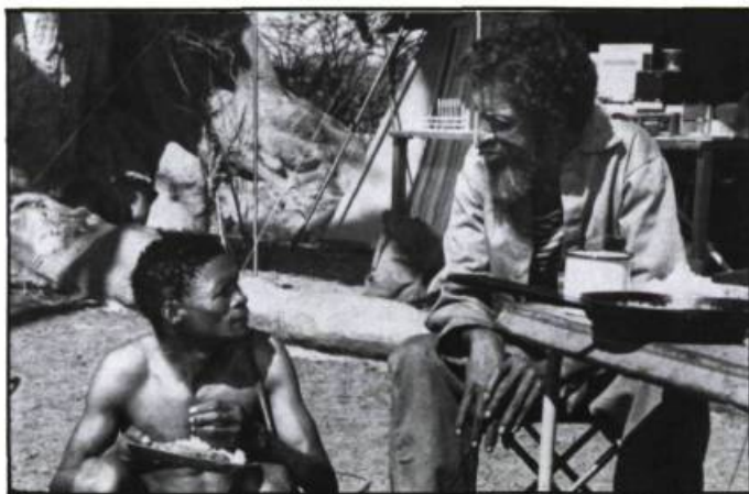
Un succès africain, Les Dieux sont tombés sur la tête .

Et encore, la liste n'est pas exhaustive. Au programme du F.F.M. il y avait également Caméra d'Afrique de Férid Boughedir (un tour d'horizon du cinéma africain contemporain), L'enfant secret de