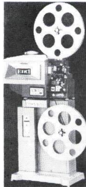
EX-9100, proj. 16mm, 2000w xénon.

Plusieurs 16 mm EIKI série 1500 - capacité 6000 pi de film - 300w xénon