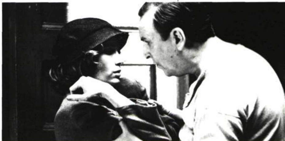
Son mari la brutalise...

Woody Allen se sert de Cecilia-Mia Farrow pour dire haut et fort sa passion pour le cinéma, son plaisir d'être assis dans une salle obscure, face à un écran magique sur lequel se déroule une histoire qui fait rêver mais n'appartient pas et ne pourra jamais appartenir au réel. L'alter ego de Woody Allen, Cecilia, est la victime consentante de cette séduction bi-dimensionnelle. C'est à travers son regard ébloui que le spectateur se laisse aller à un mélodrame parfumé à l'absurde et s'amuse du sort qu'on réserve à tous les Tom Baxter inventés par l'industrie cinématographique.