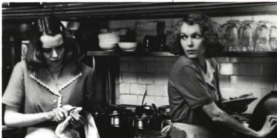
Elle travaille pour le faire vivre.

Comme plusieurs autres grands cinéastes, Woody Allen tient un discours sur le cinéma dans son œuvre cinématographique. François Truffaut a tourné La nuit américaine , Wim Wenders L'état des choses , Fellini Huit et demi . Woody Allen a maintenant The Purple Rose of Cairo , un film grand public qui a plus de force que Stardust Memories . Le cinéaste évoque la magie du cinéma, communiant, nostalgique, aux années d'or du cinéma parlant. Malicieux, il s'amuse à faire dérailler la folle machine à faire rêver qu'est le cinéma en imaginant l'étincelle que ferait l'imaginaire s'il rencontrait le réel puis en rappelant, sans ambiguïté, par une finale vidée de romantisme, que tout cela n'est que du vent. Pure chimère. Un monde parallèle.