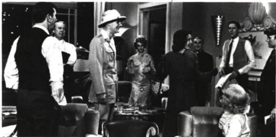
Heureusement, il y a le cinéma.

Il ne reste plus alors au spectateur des années 80 qu'à quitter la salle en fredonnant, tandis que Ginger Rogers et Fred Astaire, les rois de la comédie musicale des années 30, dansent, amoureux, sur la musique de Cheek to Cheek . Tout n'est pas perdu. Chacun peut rapporter chez lui un peu du rêve et du glamour qu'Hollywood distribue avec générosité. Chacun peut se laisser aller à danser dans la rue comme si tout allait pour le mieux dans le meilleur des mondes, une rose pourpre entre les dents. ■