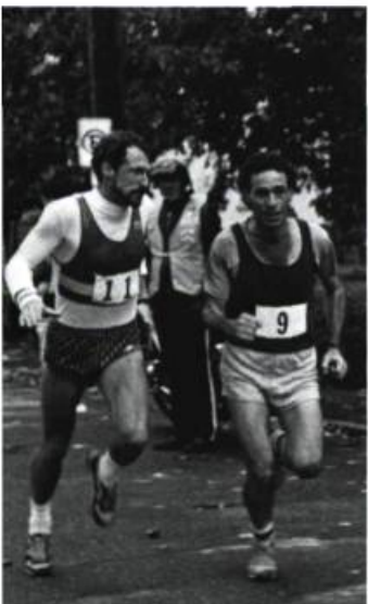
Le marathon endiablé des cinéphiles