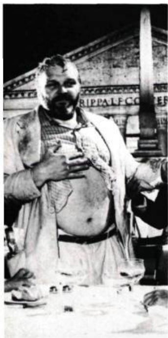
Le ventre gonflé de Kracklite vaut bien celui de sa femme, enceinte.

« Un homme mal vu commence à bien voir. » Cette phrase de Kazimierz Brandys tirée d' En