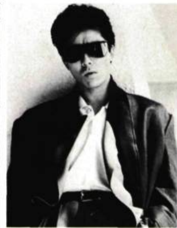
The Heartbreak Yakuza

Masato Harada : Je travaille pour différentes compagnies. Cette fois-ci, c'était pour la Sho-