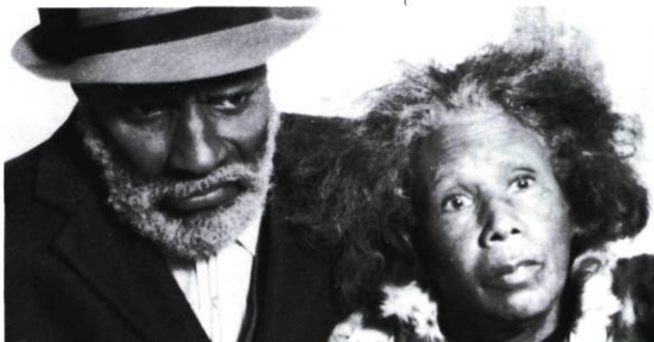
La Vieille Quimboiseuse et le majordome

Toutefois, quand j'écris, je ne pense pas à cette responsabilité face à la communauté noire, ce serait trop lourd à porter. Je cherche avant tout