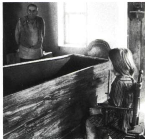
Sauvegarde et protégé d'Alexandre Sokourov