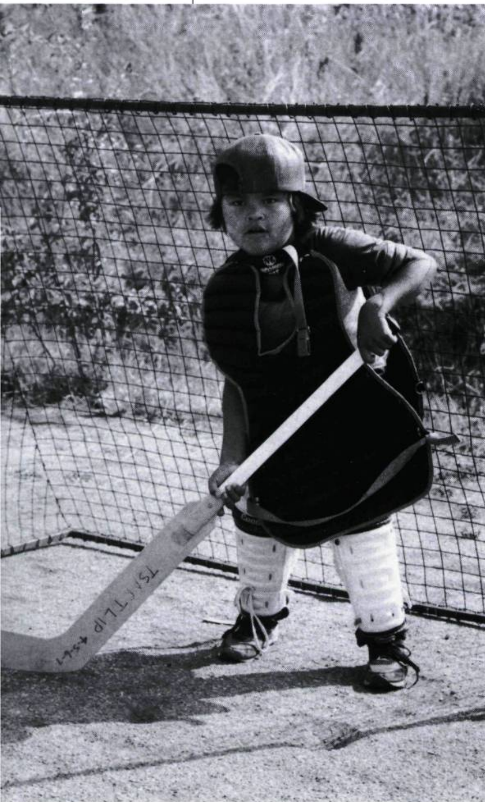
... l'avenir: jeune Indien de la nation Saanich ( l'Art de tourner en rond II )