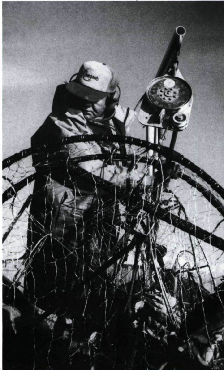
L'Indien et la mer