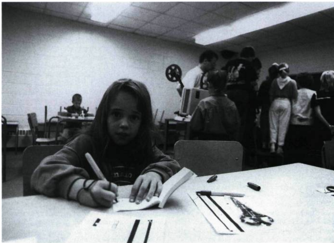
Un atelier d'initiation au cinéma dans le cadre du Carrousel international du film de Rimouski

quatre heures pour un film parce qu'il n'y avait pas consensus parmi les membres du jury; ils l'ont revisionné. Les discussions ne se limitent pas à: "j'aime ça, j'aime pas ça". Personne n'a le droit d'assister à leurs délibérations. Quand les caméras de télévision se pointent, ils simulent des discussions. Jamais, dans leur travail, ils ne subissent de pressions venant d'adultes ou de professionnels du cinéma. Et contrairement à d'autres festivals, nous n'avons qu'un seul jury. À Berlin, par exemple, il y a le jury UNICEF, un jury formé de professionnels et de jeunes.»