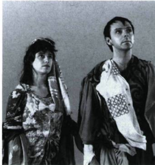
Au verso du monde

C'est ici que la question du narrateur prend toute son importance, car ce personnage est présent dans les vidéos des trois artistes. Parfois, il prend la forme du monstreur filmique in praesentia . D'après Gaudreault, on parle de monstreur filmique in praesentia quand le cinéaste est présent dans un film ou qu'il est personnifié par un personnage du récit, dont le narrateur bien entendu 6 . Un monstreur filmique est un cinéaste in praesentia dans les images d'un film, et j'ajouterais un vidéaste dans celles d'une bande vidéo. Ainsi, la présence à quelques reprises de l'un ou l'autre des réalisateurs dans le rôle de narrateur fait d'eux des monstreurs vidéographiques in praesentia . Quant aux figurants, la plupart de ceux qui font des monologues font figure de conteurs, donc de narrateurs, tandis que ceux qui racontent une histoire à deux ou à plusieurs rejoignent une forme de diègèsis associée au théâtre (tragédie et comédie) par Platon. Et c'est ainsi que se construisent