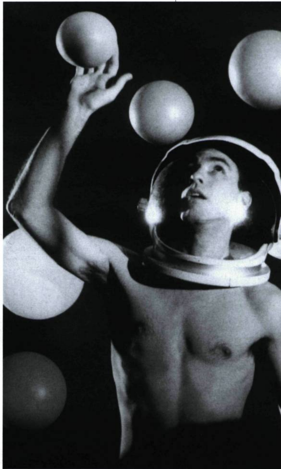
Rien ne t'aura, mon cœur de Charles Guilbert

Une problématique sous-jacente à la difficulté de déterminer si les personnages jouent leur rôle ou s'ils sont des figurants dirigés par les réalisateurs est celle de la réalité et de la fiction. Par exemple, Michal Klier, un vidéaste allemand, qualifie de fiction le Géant (1985), une bande qu'il a produite à partir de «vraies» images de surveillance mises les unes à la suite des autres, sans aucun lien entre elles et qu'il a accompagnées uniquement de musiques de film. Le seul fait de sélectionner et combiner des images