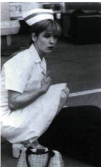
Nurse Betty de Neil LaBute