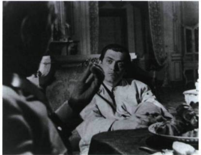
Stanley Kubrick sur le tournage de Paths of Glory

Jan Harlan: Il est toujours surprenant de constater à quel point tous ces gens-là sont également très humbles. Prenez György Ligeti, qui est l'un des doyens de la musique contemporaine. Évidemment je suis allé chez lui, avec le caméraman, en m'attendant à rencontrer une sommité. Et finalement j'ai été reçu par un vieux monsieur très obligeant qui nous a servi le café avec des petits gâteaux, comme pour célébrer notre anniversaire. Cette humilité m'a beaucoup appris et, de ce côté-là, le tournage du documentaire a été une très belle expérience. ■