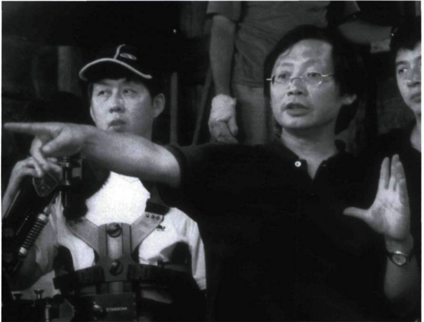
Dai Sijie, l'auteur et réalisateur de Balzac et la Petite Tailleuse chinoise

Si le cinéaste pêche souvent par excès d'esthétisme, atténuant ainsi grandement la charge politique qui était beaucoup plus forte dans son roman, il réussit à convertir même les plus sceptiques sur les plaisirs de la lecture et l'élévation qu'elle procure chez ceux qui osent s'aventurer dans l'univers des grands écrivains. Il ne réduit jamais l'instruction, l'alphabétisme à ses simples fonctions économiques (comme on l'entend trop souvent ici, où le diplôme scolaire se résume à une simple carte d'accès au marché du travail), illustrant avec poésie, et un soupçon de tristesse, ce que la lucidité, la connaissance peuvent entraîner de douleurs et de misères. Élargir ses horizons, plonger dans des mondes étrangers aux nôtres, c'est aussi s'exposer à la comparaison, à la révélation que nos frontières sont parfois trop étroites pour nos nouvelles ambitions. C'est pourquoi Balzac et la Petite Tailleuse chinoise , surtout dans sa version cinématographique — et