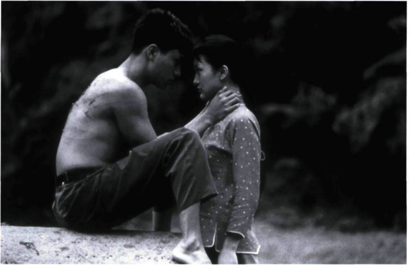
Chen Kun et Xun Zhou

époque sombre et douloureuse. Contre toute évidence, Balzac et la Petite Tailleuse chinoise devient un roman à succès, publié dans 16 pays et traduit en plusieurs langues... mais refusé par toutes les maisons d'édition chinoises qui n'apprécient pas la description des camps de rééducation, où les paysans passent très souvent pour de parfaits imbéciles.