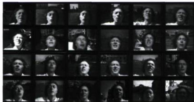
Venetian Blind (1970)