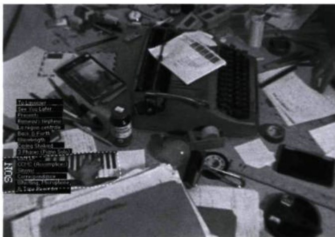
L'interface «sommaire» d' Anarchive 2 – Digital Snow

Si il faut nommer un artiste important du XX e siècle et toujours aussi actif dans le nouveau qui commence à peine, chercheur qui imprègne tout un pan de l'art contemporain et du cinéma expérimental, Michael Snow est assurément celui dont il faut retenir la contribution. Reconnu internationalement, maintes fois primé et actif depuis les 50 dernières années, il était dans l'ordre des choses de lui rendre un hommage à la mesure de son impressionnant et multiple parcours. Le Festival international nouveau Cinéma nouveaux Médias Montréal (FCMM) s'est donné ce mandat en offrant de nombreux événements qui nous ont permis de (re)découvrir le travail artistique de cet artiste 1 . Dans la foulée de ces moments consacrés à Michael Snow, il faut souligner le lancement du DVD-ROM Anarchive 2 – Digital Snow 2 , qui constitue autant une œuvre de l'artiste qu'une encyclopédie sur sa carrière.