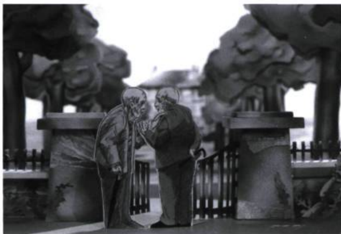
Charles et François de Co Hoedeman

D e concert avec l'Office national du film du Canada (ONF), la Cinémathèque québécoise présente une exposition consacrée au cinéaste d'animation Co Hoedeman. Préparée par Marco de Blois, conservateur du cinéma d'animation à la Cinémathèque, en étroite collaboration avec l'artiste, qui a vu personnellement à la restauration des artefacts, cette présentation permet de découvrir la genèse d'un œuvre en perpétuel renouvellement. Connue du public pour la série Quatre Saisons dans la vie de Ludovic , Hoedeman est, avec Frédéric Back, l'un des cinéastes d'animation canadiens les plus réputés à l'échelle nationale et internationale. Survol de 35 ans de carrière.