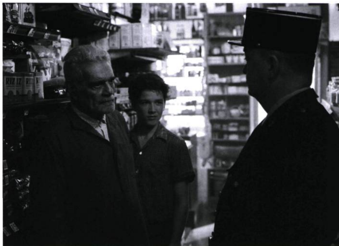
Une scène de Monsieur Ibrahim et les fleurs du Coran qui illustre bien l'attention que porte le vieil Arabe au jeune juif.

Momo, cela tombe drôlement bien, car, déambulant à toute heure du jour entre les allées étroites de ce lieu mal éclairé, il peut ainsi piquer à son aise et économiser quelques francs pour aller voir les putes, qui ne demandent pas mieux que de contenter le jeune homme de la rue Bleue.