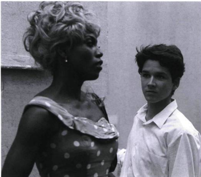
Momo aimerait bien « que sa virginité ne soit plus qu'un mauvais souvenir ».

La simplicité du récit d'Eric-Emmanuel Schmitt rend bien imprécise l'époque où se situe l'action, accentuant davantage ses allures de conte intemporel, même si l'évocation de l'Holocauste pour expliquer la tristesse d'un des personnages inscrit une marque temporelle facilement repérable. Il en va tout autrement du film de