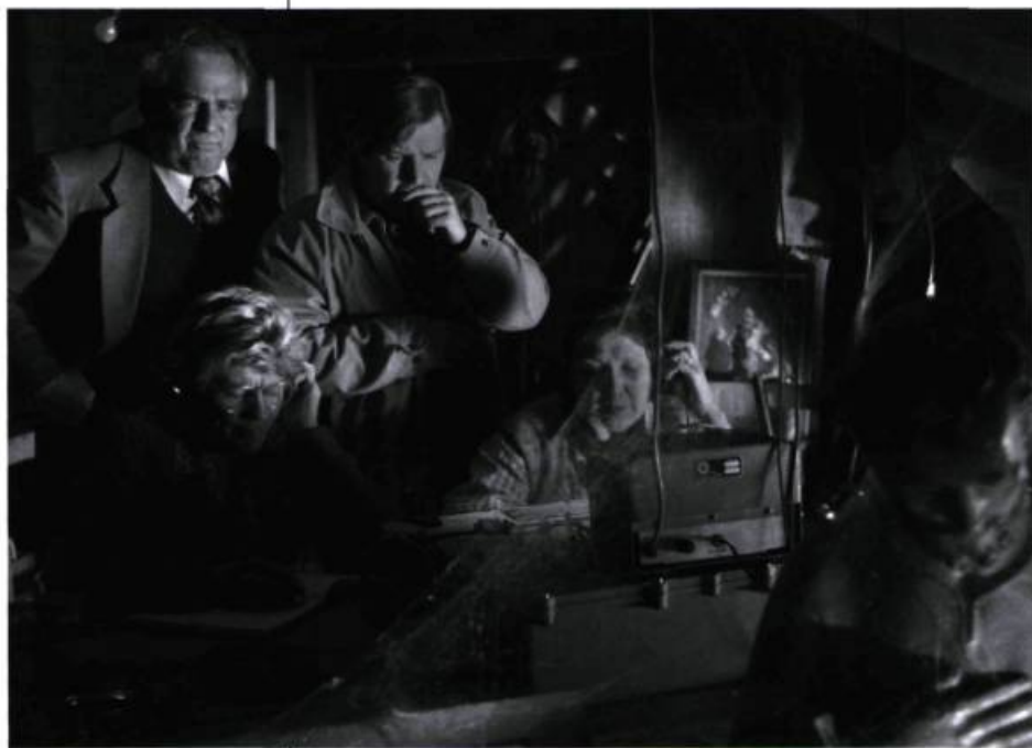
Une des scènes mémorables de La Grande Séduction : le montage n'est d'ailleurs pas étranger au succès du film.