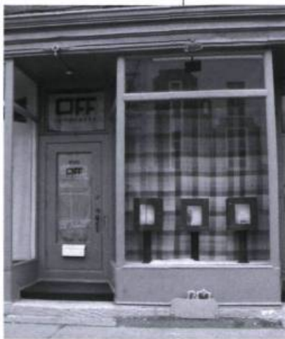
L'exposition et al. , présentée sur le boulevard Saint-Laurent, ou l'art de varier les rencontres entre les œuvres et le public

Par ailleurs, nous observons depuis plusieurs années qu'un nombre considérable d'artistes et quelques organismes du milieu des arts visuels réfléchissent sur les manières d'aborder le travail artistique. Ceux-ci soulèvent de nouvelles problématiques et revoient les façons de penser les œuvres en proposant de nouveaux paramètres de présentation. Ces questionnements sur les espaces et les lieux d'exposition sont devenus des paradigmes de création désormais ancrés dans la pratique. Perte de signal occupe ce créneau en explorant des lieux inédits de présentation pour des œuvres en arts médiatiques et sert également d'incubateur à des pratiques innovatrices et émergentes.