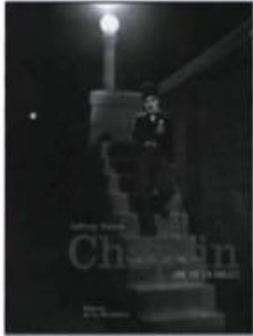
VANCE, Jeffrey. Chaplin – Une vie en images , traduit de l'américain par Paola MIGLIETTI, Paris, Éditions de la Martinière, 2004, 500 photos n. et b., 400 p.