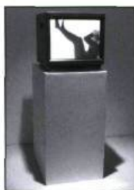
Les œuvres 10 et Routine 422