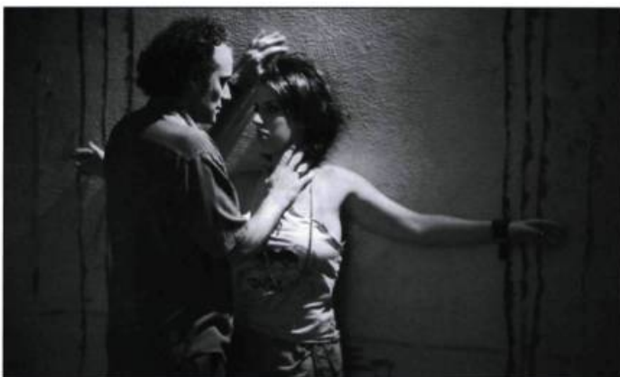
De haut en bas : Mi mejor enemigo , Casa de areia, En la cama et Crime delicado