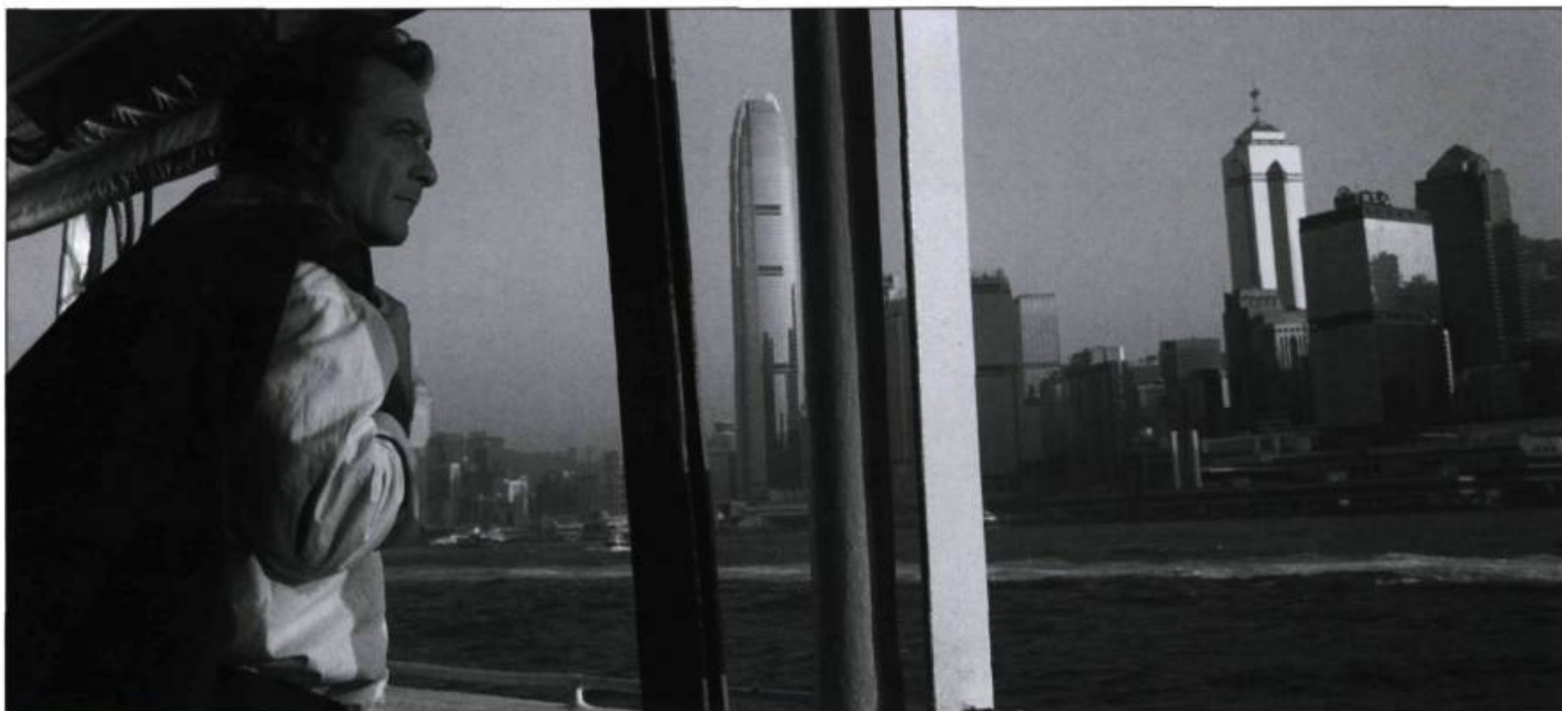
Seconde partie du film : la fuite à Hong Kong – PHOTO : NATHALIE ENO

la langue du pays) et dérivation languissante mènent à un épilogue qui soulève plus de questions qu'il ne donne de réponses. En apparence, c'est le retour à la normale, mais un fond d'anxiété dans le regard laisse présager que la machine pourrait se détraquer à tout moment et qu'il faut à tout prix demeurer aux aguets. Et surtout éviter de s'assoupir, comme le suggère la dernière image du film.