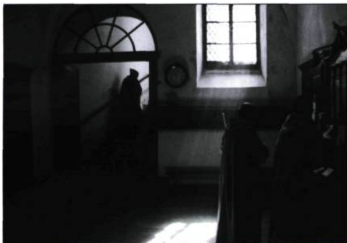
Le Grand Silence