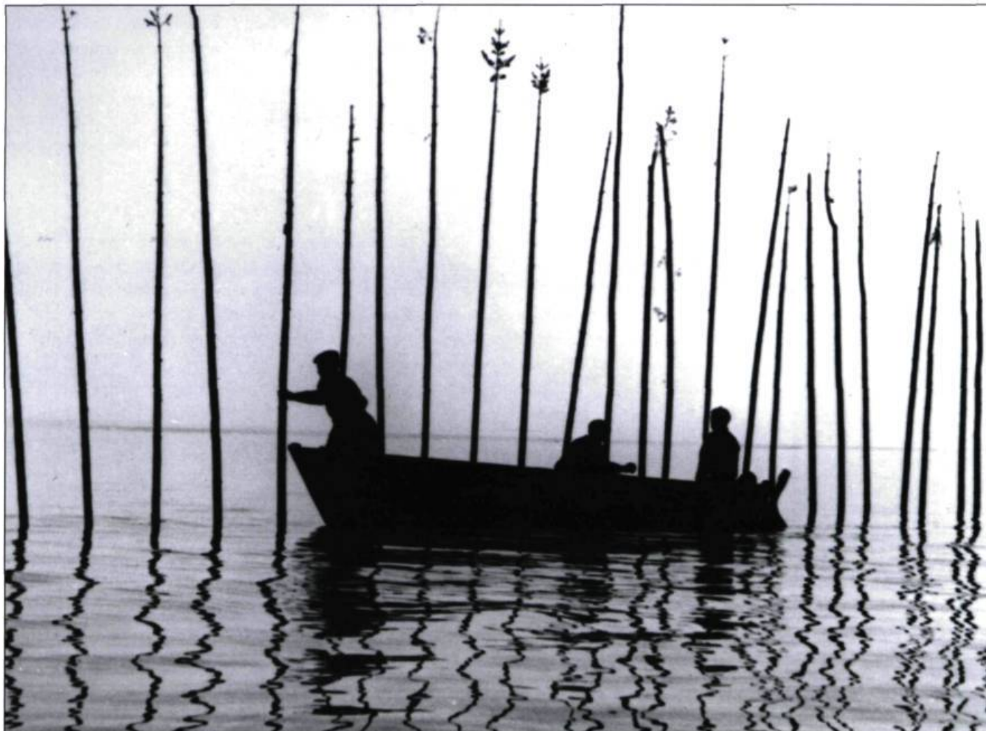
Pour la suite du monde

Et c'est bien là la grande force de Perrault qui sait être patient, parler aux gens, les écouter surtout, puis laisser le temps faire son œuvre jusqu'à toucher à l'essence même de ceux qu'il enregistre ou filme, comme peu de cinéastes savent le faire. Ajoutez à cela le travail lumineux de Brault à la caméra (coréalisateur du film) et celui de Carrière au son et l'on obtient ce chef-d'œuvre du cinéma direct qu'est Pour la suite du monde dont le titre, magnifique d'éloquence, est sorti sans tambour ni trompette de la bouche de Grand-Louis. Si ce film demeure le plus connu et s'impose comme le plus marquant des trois titres du cycle de l'Île-aux-Coudres, les deux autres — Le Règne du jour et Les Voitures d'eau — forment une suite qu'il faut (re)découvrir pour comprendre et apprécier à sa juste valeur l'œuvre de Perrault. Pour la suite du monde reste encore, avec La Bête lumineuse (1982), ce que le cinéma québécois a fait de mieux. ■