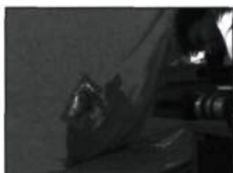
Tournage de différents projets de KinOcéan

aimerait adapter le concept aux Îles : « Pour le moment, c'est un projet d'école itinérante », précise-t-il. « Un jour, ça pourra se transformer en autre chose. En raison des coûts de déplacement élevés pour se rendre et se loger à Victoriaville, par exemple, quatre jeunes par année est actuellement un maximum pour le Ciné-Cabarouette. Il faut aussi beaucoup de temps pour mettre en place un projet comme celui-là », admet celui qui partage son temps entre son travail d'acteur à Montréal et son engagement bénévole aux Îles-de-la-Madeleine.