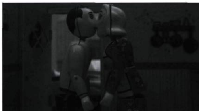
Madame Tutli-Putli de Chris Lavis et Maciek Szczerbowski; Isabelle au bois dormant de Claude Cloutier; Paradise de Jesse Rosensweet

conscience que celle-ci existe encore. Pour parvenir à ses fins, Ledune passe par un effet de distanciation renforcé par l'adresse directe du narrateur au spectateur. À cela s'ajoute un contrepoint ironique apporté par la musique et par une esthétique naïve du collage d'éléments qui ne correspond pas aux images habituellement véhiculées sur le sujet. Bien que son assemblage soit réalisé adroitement, le film, visuellement séduisant, tient parfois un propos répétitif.