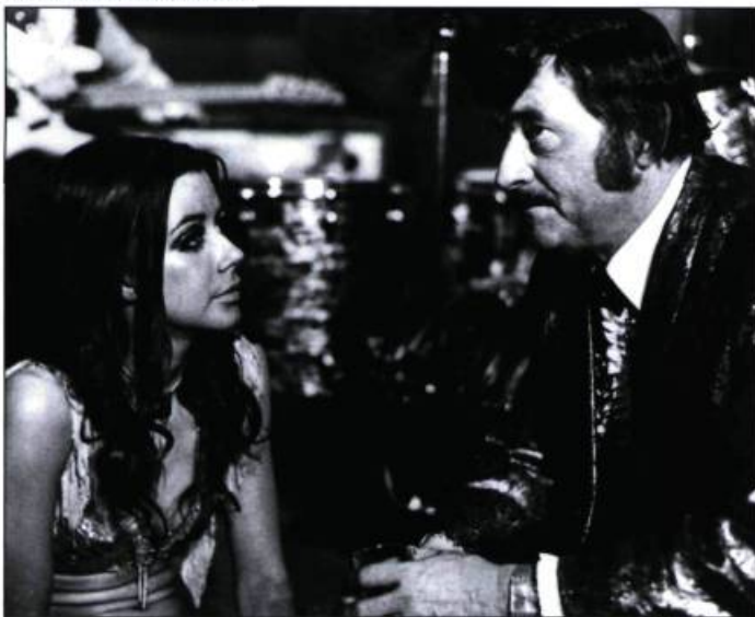
La mort d'un bûcheron