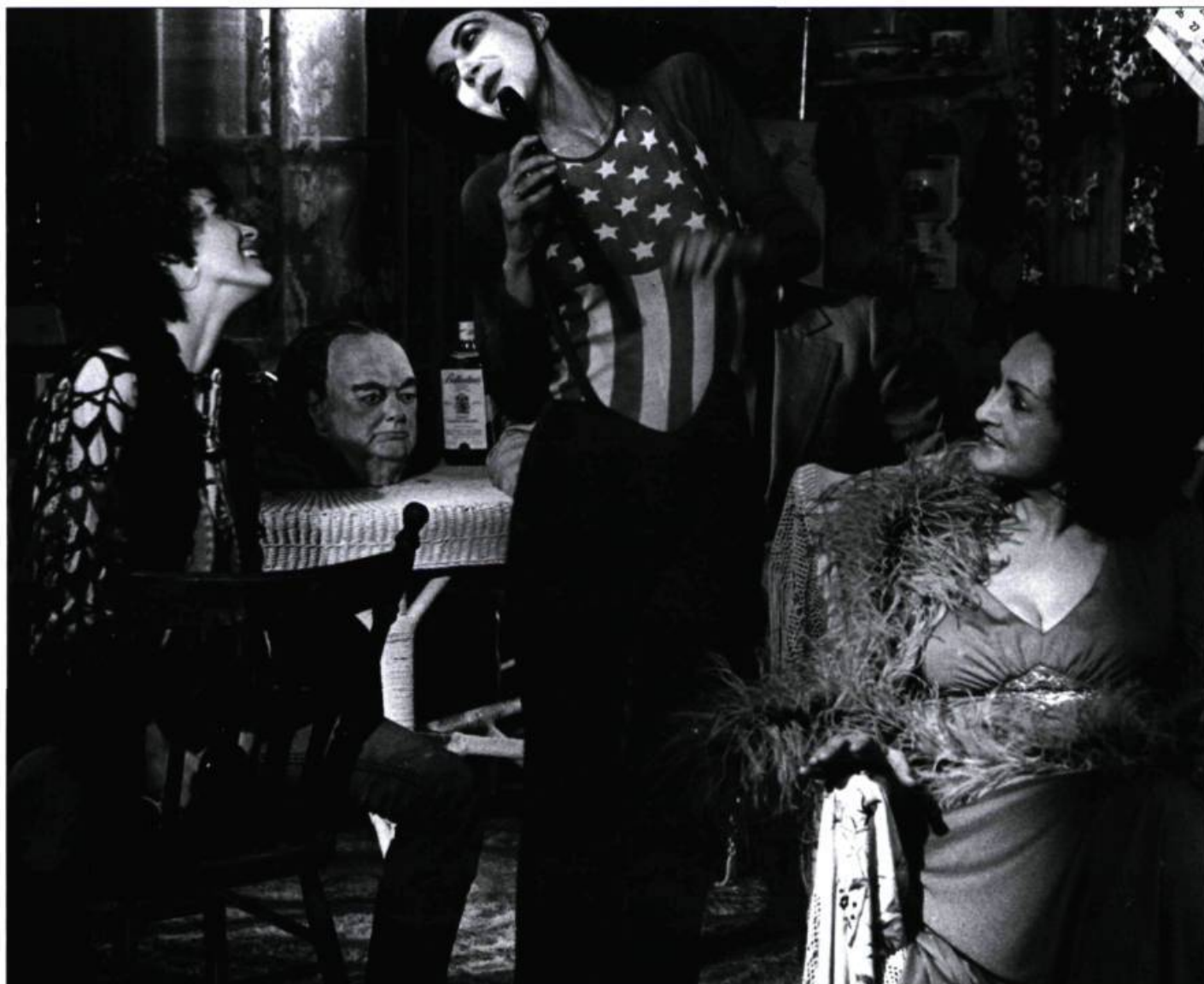
La Tête de Normande St-Onge – PHOTO : COLLECTION CINÉMATHEQUE QUÉBÉCOISE

butaire de la réalité québécoise de l'époque. Le jocal qu'ils parlent, c'est le nôtre; cette grande forêt, ce camp de bûcherons, ce bar miteux sont également une partie de notre héritage collectif. Mais c'est véritablement avec La Tête de Normande St-Onge , probablement son plus grand film, que Carle atteint un sommet de vérité et d'acuité. L'espace d'un bref moment, il ose enfin montrer ce que La Vraie Nature de Bernadette s'était abstenu d'exposer explicitement : la sexualité féminine dans toute sa vérité. Alors que Normande et son copain font l'amour, la caméra, fixe, les montre en gros plan, attentive à chaque détail. Tout Gilles Carle est dans cette scène : son goût de l'audace et sa suprême franchise. Carle, celui dont on découvre la quintessence du talent dans La Tête de Normande St-Onge , est le cinéaste qui nous montre qui nous sommes vraiment, qui dévoile une réalité que nous avons jusqu'alors refusé de voir. Directement. Sans fard ni faux-semblants, dans la brutalité de sa vérité toute nue! ■