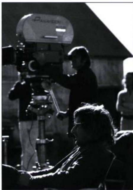
Gilles Carle tournant La Vraie Nature de Bernadette

que La Vie heureuse de Léopold Z est d'un charme absolument irrésistible, peut-être justement parce qu'il tire son ravissement d'éléments banals, du naturel désinvolte du récit et du jeu des acteurs. C'est sûrement aussi parce que Carle arrive à donner à son histoire un ton comique sans jamais tomber dans le ridicule et la facilité. Il refuse toute dramatisation, se contentant d'observer la réalité avec sincérité, rendant cet univers fictif à ce point tangible qu'on a l'impression de pouvoir y toucher.