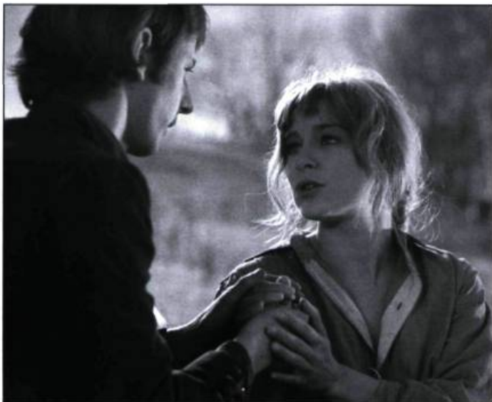
La vraie nature de Bernadette