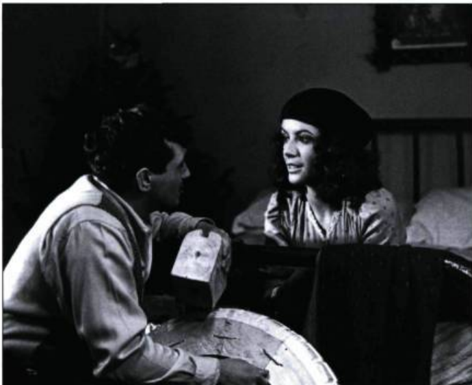
Les Corps célestes