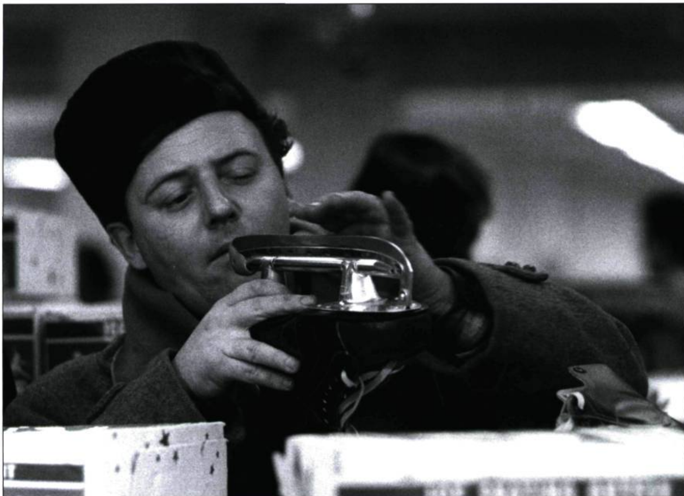
La Vie heureuse de Léopold Z

core aujourd'hui, La Vie heureuse de Léopold Z respire la fraîcheur et la désinvolture, la vivacité du premier film, alors que tout est permis.