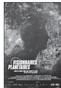
Québec / 2009 / 82 min