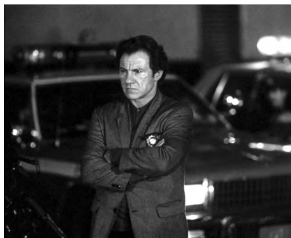
Marlon Brando ( On the Water Front ), Robert De Niro ( Raging Bull ), Christian Bale ( The Machinist ), Al Pacino ( Serpico ) et Harvey Keitel ( Bad Lieutenant )

pêtrées dans des productions luxueuses et désincarnées où la réalité sociale n'avait aucune valeur. Le cinéaste John Cassevetes peut par ailleurs se targuer d'avoir été à cet égard un précurseur, lui qui laissait les acteurs libres d'improviser les scènes de son film Shadows en 1960.