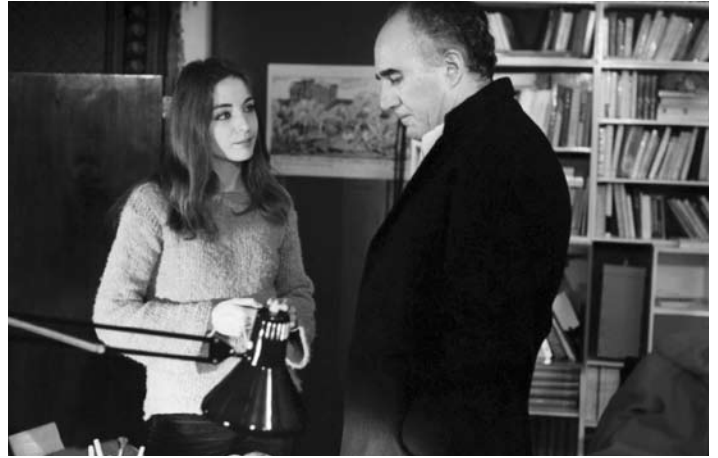
Des enfants gâtés

C'est gênant de prendre parti pour un ange exterminateur.