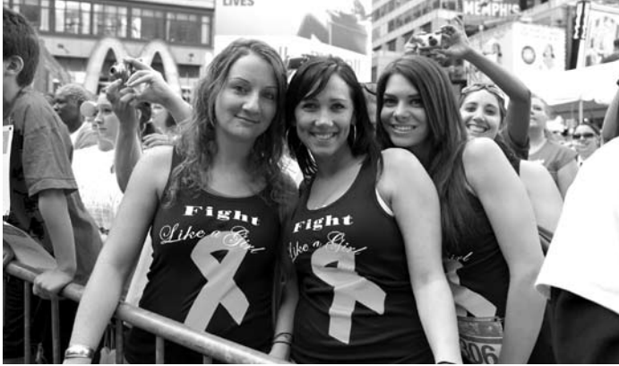
Participant au 2010 Revlon Run/Walk for Women à New York