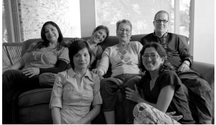
Membres de la IV League

questionner sur les raisons qui poussent tant de compagnies à choisir spécifiquement le cancer du sein comme cheval de bataille. « Pourquoi le cancer du sein? Pourquoi pas le cancer du poumon? Celui de la prostate? Parce que ça ne se vend pas le cancer du poumon, pour lequel tu peux blâmer les gens qui n'avaient qu'à ne pas fumer, et la prostate, ce n'est pas aussi sexy, sensuel, féminin, maternel que le cancer du sein », avance la cinéaste.