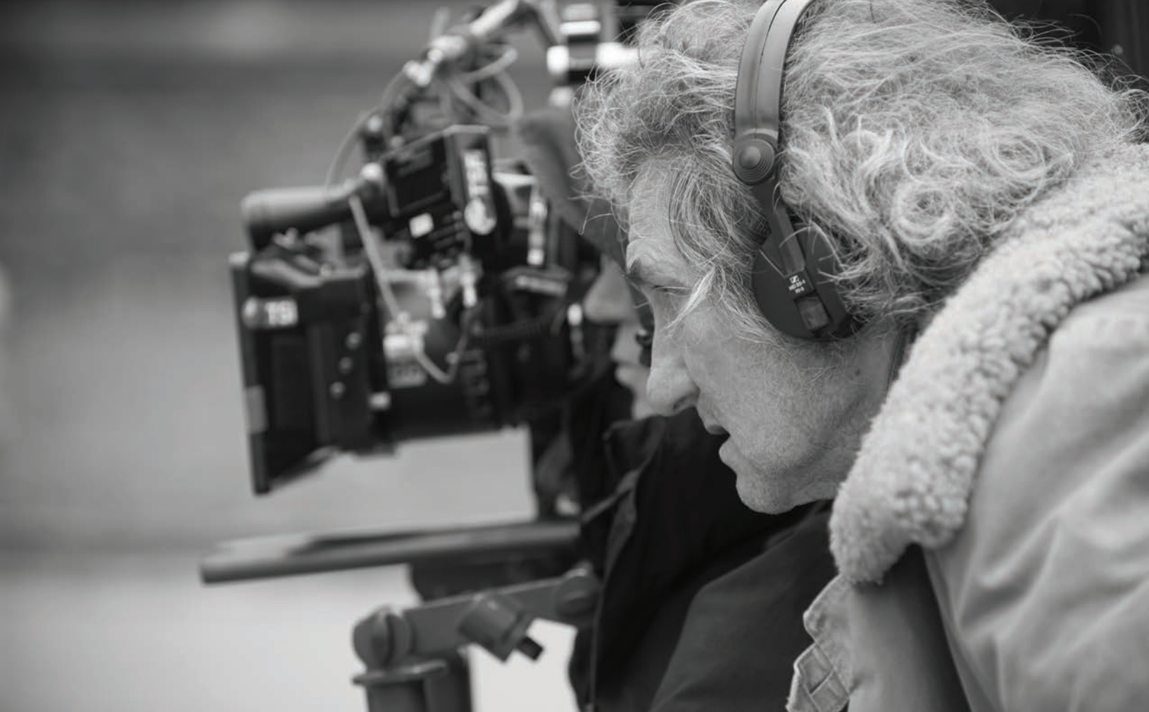
Philippe Garrel sur le tournage de La Jalousie

évidemment durer. Bientôt, c'est la rupture, que le jeune homme ne supporte pas, ce qui le pousse au suicide. La panoplie de couleurs vives qui jaillissent à l'écran détonne avec le noir et blanc contrasté des autres films de Garrel, mais le regard, lui, reste inchangé: profond, évanescent et plein d'une sublime mélancolie.