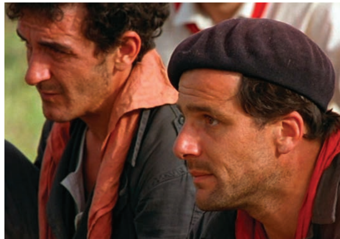
Land and Freedom

de la culture, et donner la parole à celles et à ceux qui autrement demeureraient dans l'ombre. Dans ses meilleurs films, surtout ceux des 10 premières années, Loach filme les marginaux, les écopés, les ratés, tous ces « perdants magnifiques », sans misérabilisme ni glorification. Il insiste également pour que nous puissions entendre une langue parlée, et non un langage policé et par ce fait même déconnecté du monde. Cela lui a d'ailleurs valu de voir son film Sweet Sixteen interdit au moins de 18 ans, en raison du langage cru utilisé par ses personnages. Pour Loach, cette interdiction représentait le comble du ridicule. Dans une lettre au quotidien The Guardian au moment de la sortie du film 1 , le scénariste du film, Paul Laverty, qui a aussi écrit la plupart des films de Loach depuis Carla's Song en 1996, s'étonnait qu'une société comme la Grande-Bretagne, qui juge les adolescents capables d'avoir des permis de conduire et des passeports, d'aller en prison, les juge trop jeunes pour voir un film utilisant un vocabulaire qui est pourtant le leur.