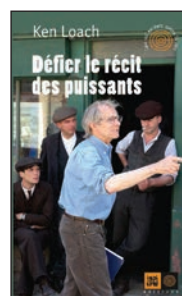
Défier le récit des puissants Ken Loach Éditions Indigènes Paris, 2014, 46 pages